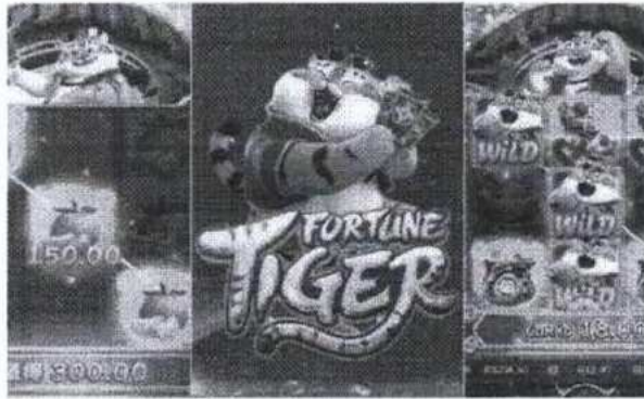
USUÁRIOS REVELAM COMO FORAM LESADOS FINANCEIRAMENTE PELA PLATAFORMA

Inicialmente a plataforma só deixava sacar o total de 12 reais por dia. Entre em contato com o suporte e eles me orientaram a depositar mais dinheiro para poder sacar um montante maior. Foi o que fiz. Acabei depositando mais 110 reais. Tentei sacar 300 e o pix não caía na minha conta. Então, o suporte me orientou a ser membro vip, só que eu teria que depositar mais 135 reais. Assim o fiz. Depois que depusitei esse valor, o atendimento da plataforma bloqueou meu número, não consegui mais fazer nenhuma aposta e meu dinheiro está todo retido lá. Perri mais de 600 reais", relata o eletricitista.